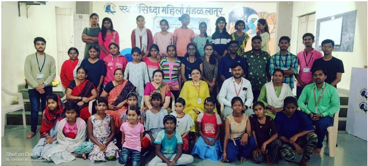
“ Mayechi Ubani Manuskicha Faral /Cloth Distribution on dated 20/10/22 ”