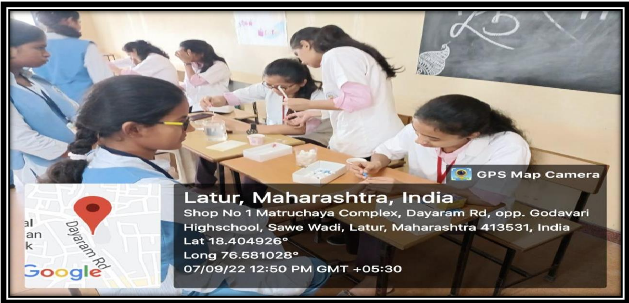
“Free HB check-up camp at Godavari School Latur”